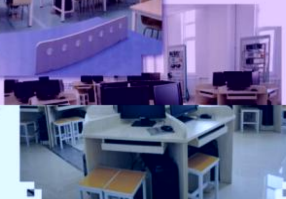
一体化课程教学设计综合实训室