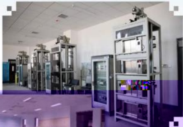
智能电梯安装调试维护训练场所